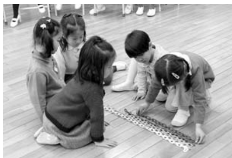
鎖の長さを比べる

大学闘争を経験した世代だからこそ、変革の先頭に立たなければならぬ。公教育の矛盾を一つずつ解決していかなければならない。大学で教育を学んできた人間だからこそ、既存の考え方を打ち破る新しい実践を自ら示さなければいけない…そんな思いを持ちながら、現場にこだわり続けてきました。しかし、この世界から逃げ出したいと思っただことが2度ほどありました。一度目は、「保育の世界に、男性がかかわることにはどんな意味があるのだろうか」と疑問を抱いた時。そしてもう一度は、民間で行う教育活動において、「経営」と「教育」のはざまで悩みながら、そもそも教育を商品化することに矛盾があるのではないか迷った時でした。そんな壁にぶつかりながらも、42年間現場でやってくることでできたのは、「幼児期にこそ、しっかりとした基礎教育を行わなければならない」という強い思いがあったからです。 幸い、私が現場から発想して作り上げた、幼児のための教具・教材が評価され、現在全国で200余りの書店に直接取引で教材を